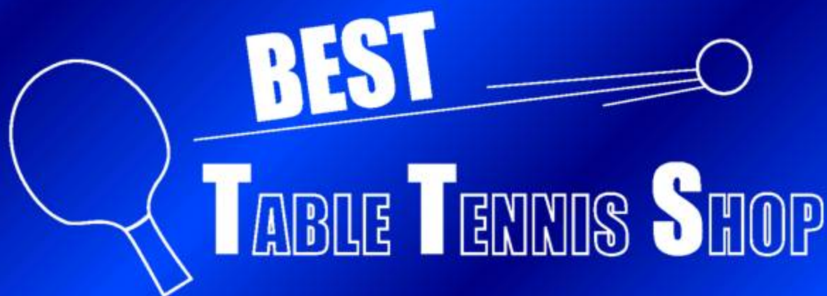
TABLE TENNIS SHOP